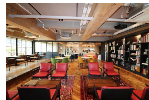
テレワーク時に利用可能なサテライトオフィス（TIME WORK）