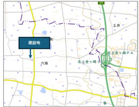
LOGIWITH 北上金ヶ崎 建設地 国土地理院サイト ( https://maps.gsi.go.jp/ ) を加工・作成

また、「物流の 2024 年問題」を背景としてトラックドライバーの長距離運転負担の軽減や輸送効率の向上に資する中継拠点のニーズが高まっています。本施設は仙台市から車で約 2 時間の場所に位置しており、東北エリアにおける広域配送の中継地点として利便性の高い立地です。