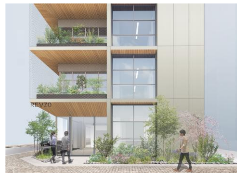
緑豊かな外構・エントランス（イメージ）