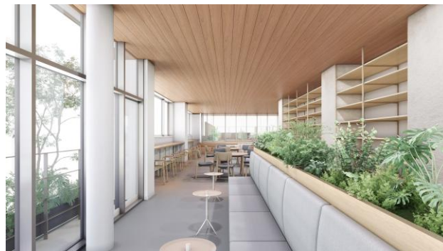
ワーカーラウンジ（イメージ）

ラウンジにさまざまな居場所をしつらえることで、ワーカーの個性にあった”はたらく”を支援します。