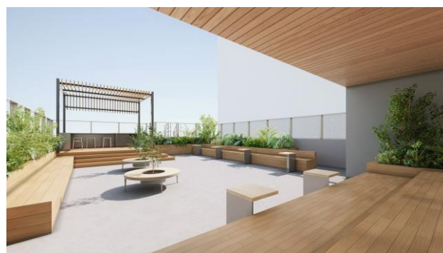
屋上テラス（イメージ）

屋上テラスはラウンジと一体での貸切利用が可能で、シンク付きカウンターを備えています。ワーカー同士の交流、展示会などのイベントのほか、テナント企業さまが求めるさまざまなビジネスシーンに活用いただけます。