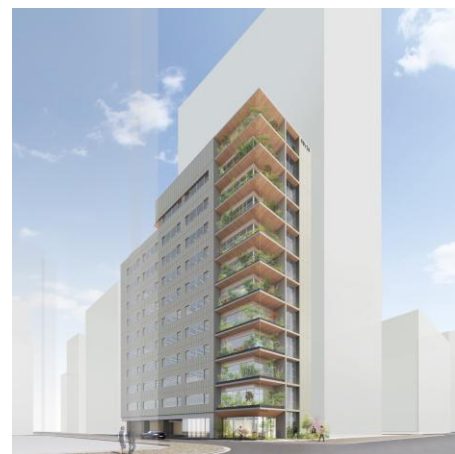
外観パース（イメージ）

各フロアには、メインストリートに面するL字型の緑化バルコニーを設置し、ワーカーが外気に触れ、光や風を感じられる空間を生み出します。全てのバルコニーに開閉可能な窓を備えており、気軽に屋外に出て、オフィスビルにいながら開放的な空間で自然を感じることでリフレッシュでき、ワーカーの皆さまに健やかな時間を提供します。