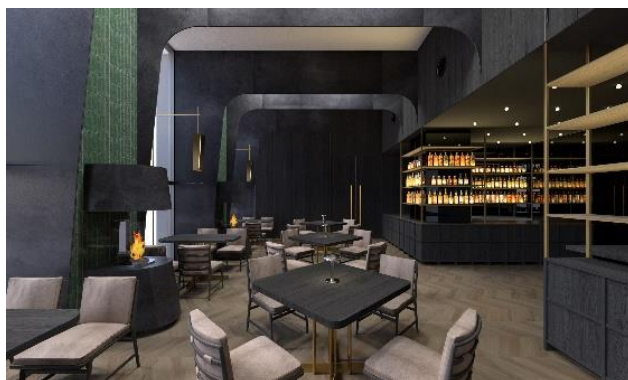
オールデイダイニング完成イメージ (名称未定)