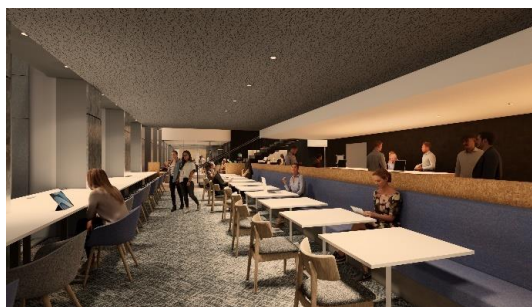
ワーカールウンジ (イメージ)

10 階には本施設の入居テナントが利用できる広々とした「ワーカールウンジ」(利用無料)、全 18 室の「ソロルーム」(事前予約・従量課金制)、最大 100 名超を収容できる「カンファレンス」(事前予約・従量課金制)などを設ける予定です。自由に利用できる共用施設と「SENQ 淀屋橋」を併設することで、入居テナントと SENQ 会員との協業や、ワーカー同士、テナント同士のオープンノベーションの機会を創出します。