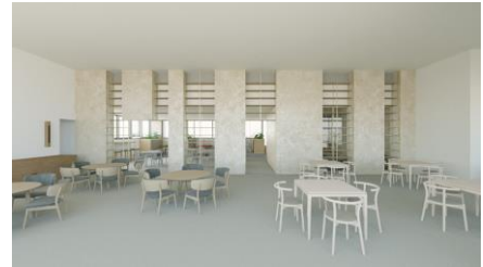
共用ラウンジ（イメージ）

最上階はテナント企業さまが利用可能な共用ラウンジを設けます。来客時や作業などに利用できる会議室・ブースを備えたエリアと、自由な打ち合わせが可能なオープンラウンジに区分し、知的交流・創造の場として多様な働き方とコミュニケーションを促します。バルコニーは北側と南側に設け、明るく開放的な空間とする計画です。