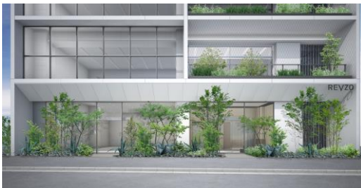
建物低層部（イメージ）