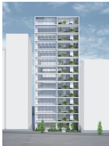
建物外観（イメージ）