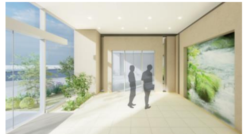
エントランス（イメージ）