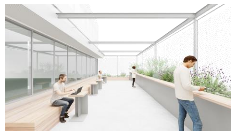
8階屋外テラス (イメージ)