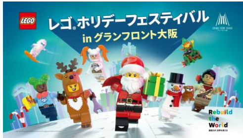
「レゴ®ホリデーフェスティバル in グランフロント大阪」 キービジュアル