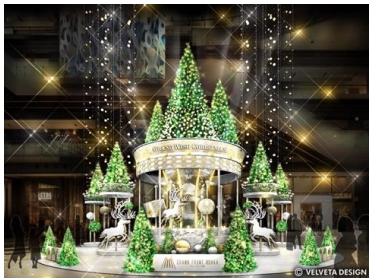
メインクリスマスツリー 「Joyful-Go-Round Tree」イメージ

他にも、Instagramのフォトキャンペーンやショップ&レストランのプレミアム賞品プレゼントキャンペーンなど、期間中に行われるさまざまな展開やイベントを通じて、グランフロント大阪10周年イヤーの締めくくりにあふさわしい感動体験をクリスマスにお届けします。