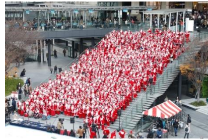
「Grand Santa Bells」 2019年開催の様子