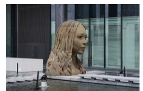
▲展示中の作品 「FOREIGN MATTER: 'Sand in woman」 異物: '砂の女」