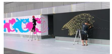
▲過去の作品制作の様子