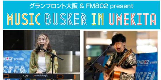
▲普段の活動の様子