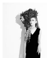
▲アーティスト R E M A

https://www.grandfront-osaka.jp/event/3420/