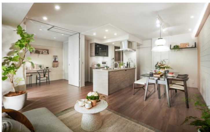
LDK のイメージ図 (モデルルーム)