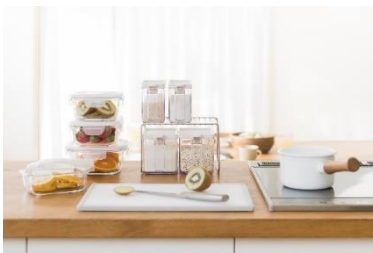
【関西最大店舗】 KEYUCA 4月28日移転オープン予定

URLはこちら: https://www.grandfront-osaka.jp/files/20230221/b3f339d8b53cf4a87148c90244cb85110776457b.pdf