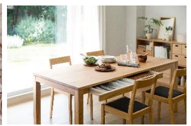
【関西最大店舗】 無印良品/Café & Meal MUJI 秋に店舗拡大オープン予定