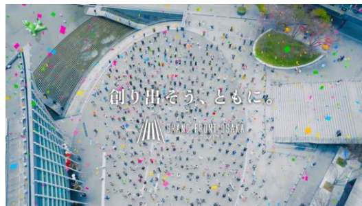
▲新ビジョンを表現した「GRAND VISION MOVIE」