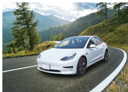
「特斯拉」社製EV「モデル3」（イメージ）