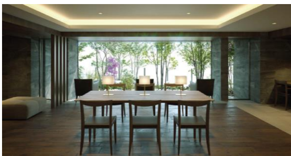
エントランスラウンジ（イメージ）

また本物件では、「特斯拉」社製の人気EV（電気自動車）「モデル3」の利用ができるカーシェアリングサービスを導入します。1台分の車両と充電設備を敷地内に設置し、15分単位での利用が可能です。入居者はスマートフォンアプリ上で予約、利用、決済までの全ての処理が可能で、車を保有していない入居者が買い物やレジャーの際に気軽に利用することができます。