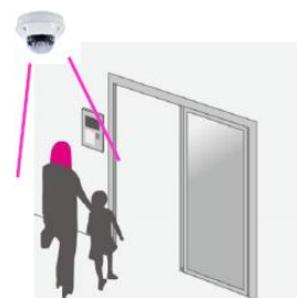
顔認証セキュリティシステム

そのほかにも、警備会社と提携した24時間セキュリティシステムを導入し、緊急時に建物内のセンサーが異常を感知すると警備会社へ自動通報され、専門スタッフが状況に応じて迅速に対応するなど、安心・安全な住まいを提供します。