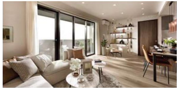
リビング・ダイニング (イメージ)