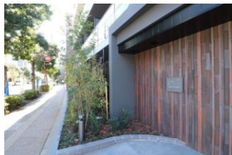
メインアプローチ

共用部は、エントランスホールに内照式の光壁を設置したほか、坪庭や緑地に面した全面に窓ガラスを採用し、緑と光が融合した開放感ある空間を演出しました。また、2階以上は内廊下の床を絨毯敷きとし、ホテルライクな高級感のある仕様としました。