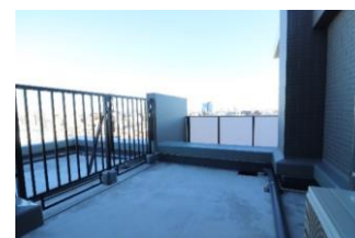
ルーフバルコニー

居室内は、システムキッチンや浴室乾燥機、最大通信速度2GbpsのWi-Fiなど、人気の設備を全居室に備えたほか、8階と9階の1DKの居室には、広々としたルーフバルコニーを設置しました。また、1Kの居室には壁面に格納可能なデスクおよびシェルフを設け、在宅での仕事や勉強などに活用いただけます。