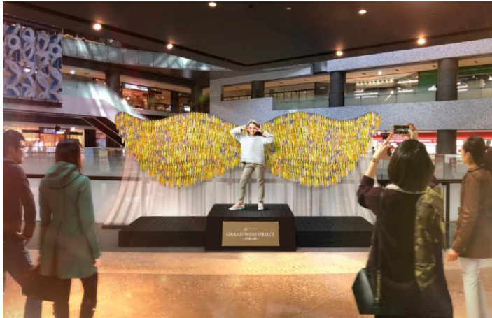
▲オブジェ完成イメージ