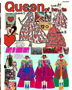
GRAND WISH STUDENT COLLECTION 展示衣装イメージ

※新型コロナウイルス感染拡大の状況等により、本イベント内容は一部変更、または中止となる可能性がございます