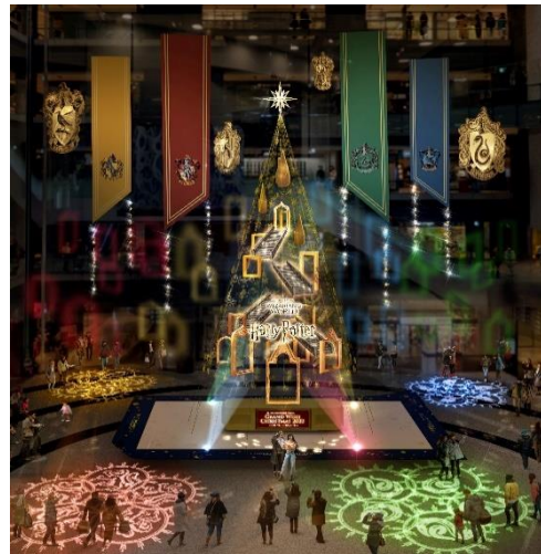
▲演出時のイメージ

「ハリー・ポッター」魔法ワールドの物語に登場するモチーフが各所に散りばめられた約 13m のメインクリスマスツリー『Floating Magic Tree 浮遊する魔法の樹』がナレッジプラザに登場。