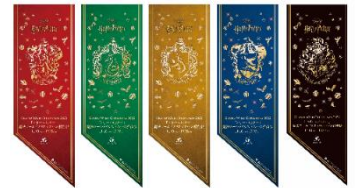
▲フラッグ装飾イメージ