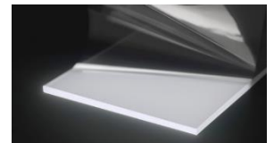
▲「RAYCREA(レイクレア)」イメージ

ライティングショーで浮遊する階段を行き交う不思議な足跡などの幻想的な演出は、日東電工株式会社が開発した最新技術「RAYCREA(レイクレア)」を使用することで実現しました。「RAYCREA(レイクレア)」は、新しい光の表現を可能にする光制御技術で、ガラスやアクリル板に「RAYCREA(レイクレア)」のフィルムを貼付し、パネルの端部に LED 光源を設置することで、フィルムを貼付した面全体を光らせることができます。※日東電工株式会社 HP: https://www.nitto.com/jp/ja/products/raycrea/ さらに、ツリーの各所に散りばめられた「ハリー・ポッター」魔法ワールドのモチーフは、再利用が可能な紙パネルである日本セキソー株式会社の防災白パネルを使用しています。大型造形にも耐える強度と、印刷しても再利用可能という環境への配慮が施された素材です。