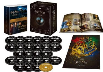
▲プレゼント賞品イメージ

グランフロント大阪館内のクリスマス装飾やフォトスポット、イルミネーション、グルメなどの写真にハッシュタグ「#グランフロントクリスマス」を付けて Instagram に投稿いただいた方の中から、抽選で魔法ワールドグッズをプレゼントする SNS 投稿キャンペーンを実施します。さらに、館内8箇所のスポットをコンプリートしたスタンプラリー台紙の写真を投稿いただいた方はWチャンス企画にも参加いただけます。