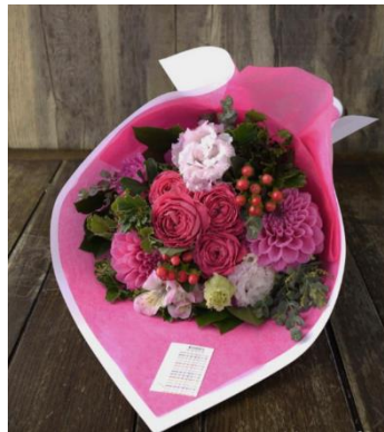
▲ 南館 B1F 「les mille feuilles de liberte」 ブーケイメージ

グランフロント大阪ショップ&レストランの対象店舗で 5,000 円以上(税込・合算可)のお買い物やお食事をされたレシートの写真を撮影し「グランフロント大阪 ショップ&レストラン」LINE 公式アカウントよりご応募いただいたお客様の中から抽選で、南館 9F 「THE COSMOPOLITAN GRILL | BAR | TERRACE」ペアディナーチケットや、南館 B1F 「les mille feuilles de liberte」ブーケ、もしくはアレンジメントのプレミアムな賞品をプレゼントいたします。