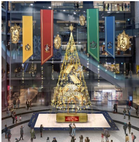
▲通常時のイメージ