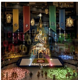
メインクリスマスツリー 『Floating Magic Tree 浮遊する魔法の樹』