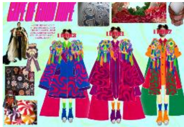
▲展示衣装イメージ

大阪文化服装学院・スーパーデザイナー学科の学生たちが「WISH(希望・願い)」をテーマに制作した衣装を北館各所に展示します。未来のトップデザイナーを目指す学生たちが、東レ株式会社の高感度・高機能スエード調人工皮革「ウルトラスエード®」を使用し制作した、個性あふれる衣装の数々をお楽しみいただけます。