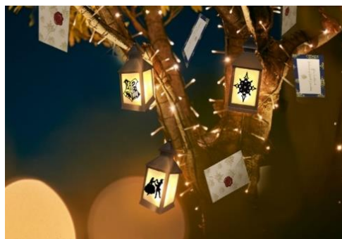
▲「ハリー・ポッター」モチーフの特別装飾イメージ

JR 大阪駅前に広がる約 1ha におよぶ「うめきた広場」の周辺やけやき並木、北館西側歩道の樹木 94 本にシャンパンゴールド色の LED 約 33 万球が上品に光り輝きます。