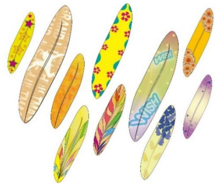
▲メッセージカードイメージ

大阪文化服装学院の学生たちによってデザインされたメッセージカードに、来街者・就業者の皆様から「WISH(希望・願い)」を込めたメッセージを記入いただき、ご自身でオブジェに飾り付けていただく参加型イベントを開催します。まちに訪れる一人ひとりの皆様と共に創り上げる、世界に一つだけのオブジェが期間限定で登場します。