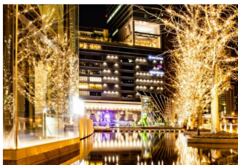
▲過去のシャンパンゴールドイルミネーションの様子