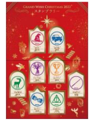
▲スタンプラリー台紙イメージ