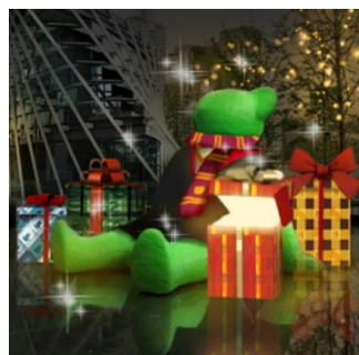
「テッド・イベール」特別装飾 ～魔法ワールドからのギフトボックス～