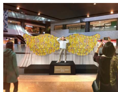
GRAND WISH OBJECT～希望の翼～ オブジェ完成イメージ