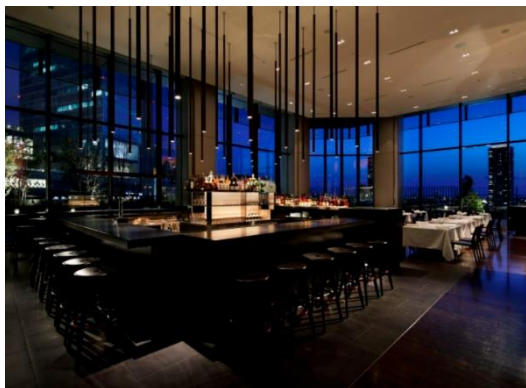
▲ 南館 9F 「THE COSMOPOLITAN GRILL | BAR | TERRACE」 店内イメージ