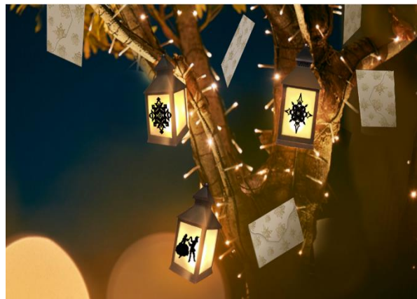
▲「ハリー・ポッター」モチーフの特別装飾イメージ

JR 大阪駅前に広がる約 1ha におよぶ「うめきた広場」の周辺やけやき並木、北館西側歩道の樹木 94 本にシャンパンゴールド色の LED 約 33 万球が上品に光り輝きます。