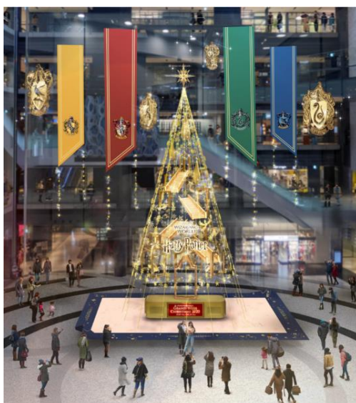
メインクリスマスツリー 『Floating Magic Tree 浮遊する魔法の樹』