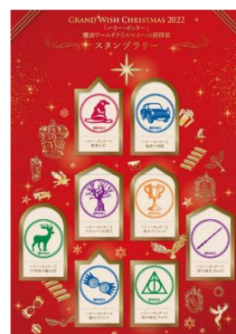
▲スタンプラリー台紙イメージ