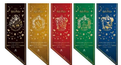
各所に「ハリー・ポッター」魔法ワールドモチーフの装飾が登場！

※新型コロナウイルス感染拡大の状況等により、本イベント内容は一部変更、または中止となる可能性がございます。