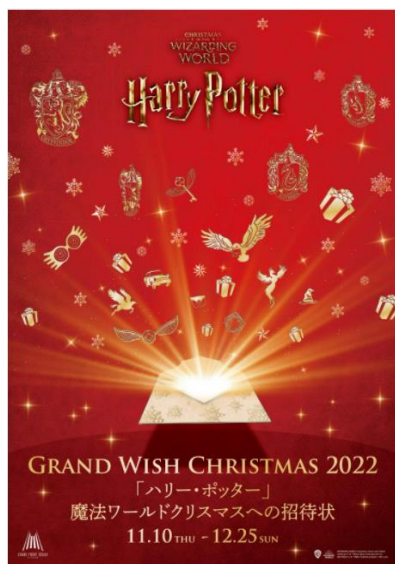
イベントメインビジュアル