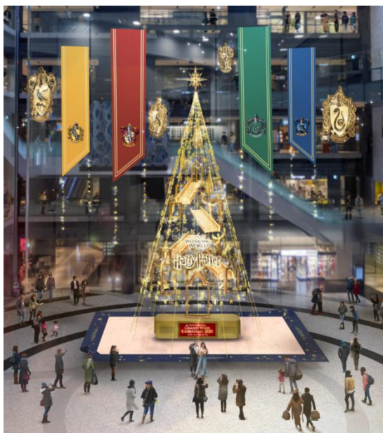
▲通常時のイメージ