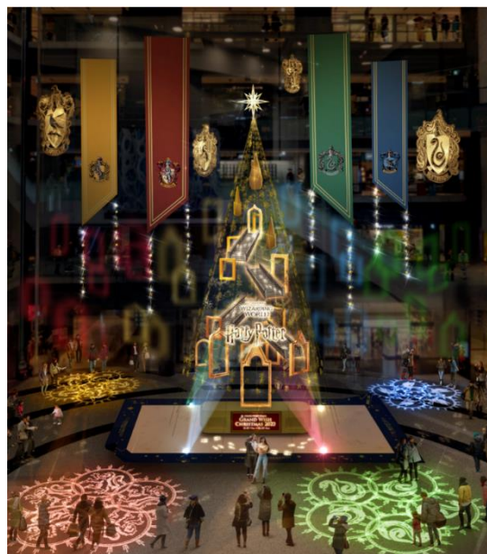
▲演出時のイメージ

「ハリー・ポッター」魔法ワールドの物語に登場するモチーフが各所に散りばめられた約13mのメインクリスマスツリー『Floating Magic Tree 浮遊する魔法の樹』がナレッジプラザに登場。