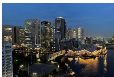
最上階からの眺望

居室内は、システムキッチンや浴室乾燥機、追い炊き機能を備えた浴室（2LDK居室のみ）など人気の設備を装備したほか、全居室に最大通信速度2GbpsのWi-Fiを完備しました。在宅ワーク時のウェブ会議や、大容量の動画視聴などの際にストレスなくご利用いただけます。また、一部の居室には、壁面に格納できるパソコン用デスクおよびシェルフを設置し、在宅ワークに対応した仕様としました。