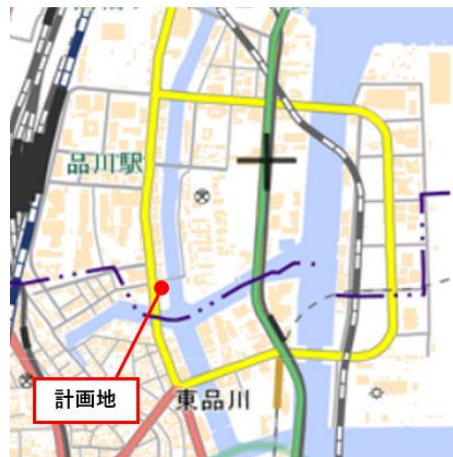
位置図 ※国土地理院サイトを加工・作成 ( https://maps.gsi.go.jp/ )

このようなエリア特性を踏まえ、利便性を重視する職住近接志向の単身者や DINKS 世帯向けの賃貸住宅としました。