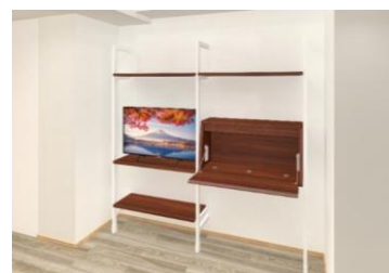
壁面格納式デスク（イメージ）