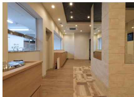
バウスクロス相模大野 共用スペース