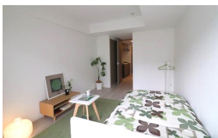
居室 (1K タイプ)

各居室も「白」を基調とし、床や建具にはナチュラルな木目調を用いて、洗練された落ち着きのある空間としています。洗面台やユニットバスなど一部の壁面には、フロアごとに色の異なるアクセントウォールを採用しました。