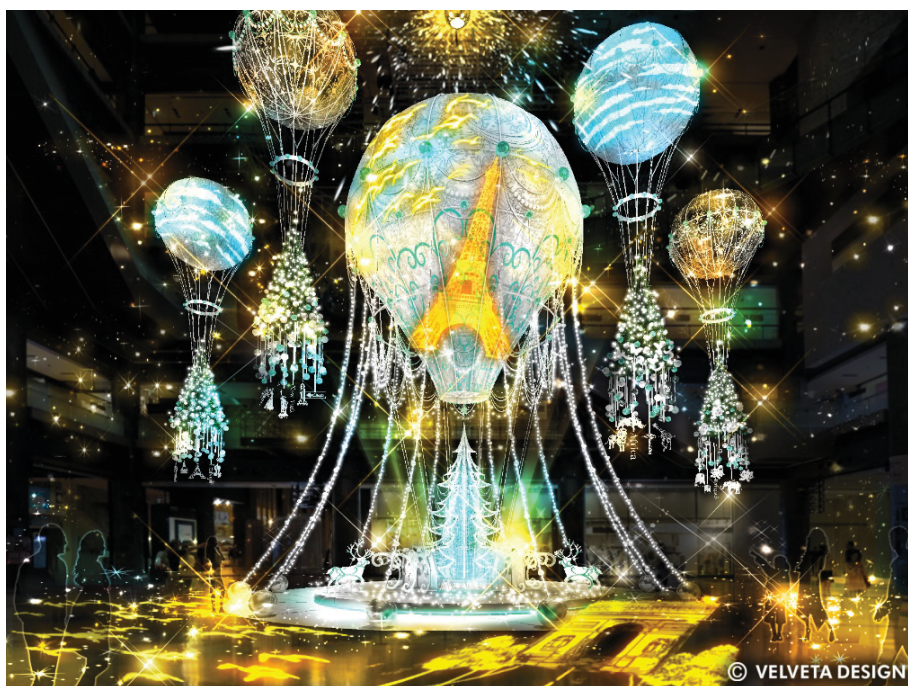
ライティングショー実施イメージ

大陸を巡り旅する気球たちは希望の光を運び、世界中の空をひとつに繋いでいく。この冬、願いを届ける幻想的なクリスマスツリー『Winter Voyage Tree』がナレッジプラザに登場します。それぞれの気球に彩られたオーナメントは、一つ一つ個性あふれる世界各地の建造物や植物、動物たちをモチーフに表現し、期間中は世界各国を旅するイメージを光で表現した「ライティングショー」も開催します。