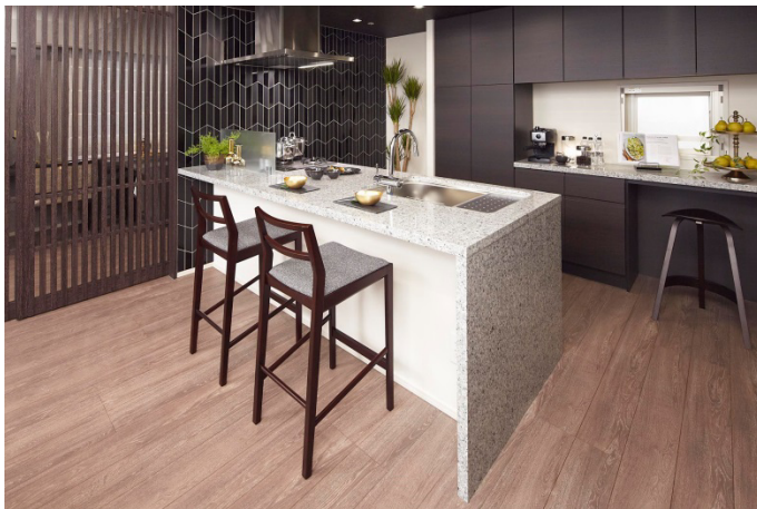
▲モデルルーム写真（キッチン）