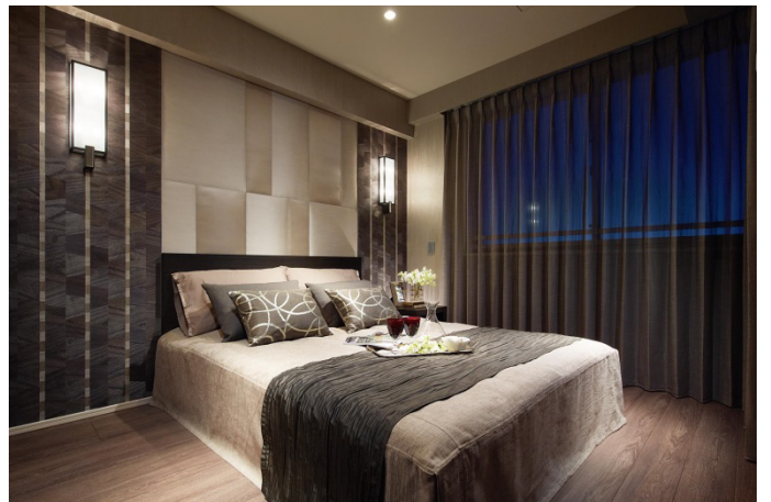
▲モデルルーム写真（主寝室）