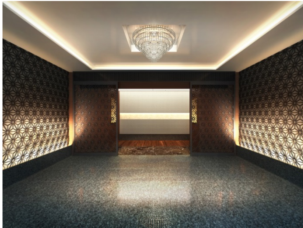
▲エントランスホール（イメージ）

エントランスから共用部にかけては、石、タイル、木、金属、ガラスなどの多様な素材の調和を生み出します。エントランスホールにはスワロフスキーのシャンデリアや、伝統の麻の葉の組子模様を施すことで、デザインコンセプトである「折衷精神」を表現しています。