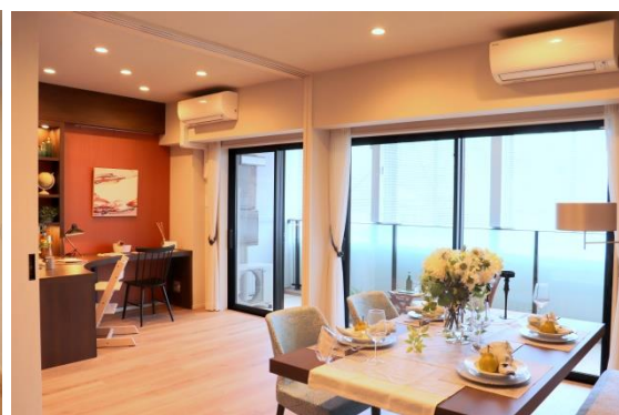
▲モデルルーム写真 (リビング・ダイニング、洋室)