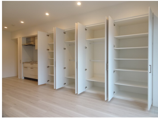
▲豊富な収納スペース（1Rタイプ）