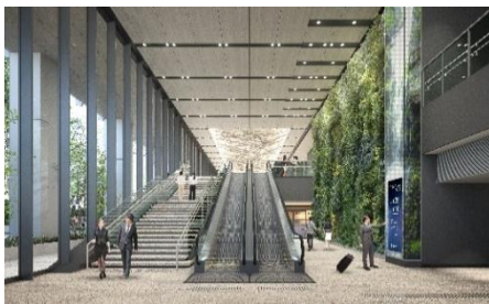
1Fエントランス(イメージ)