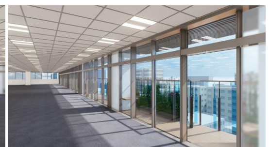
基準階設置テラス(イメージ)