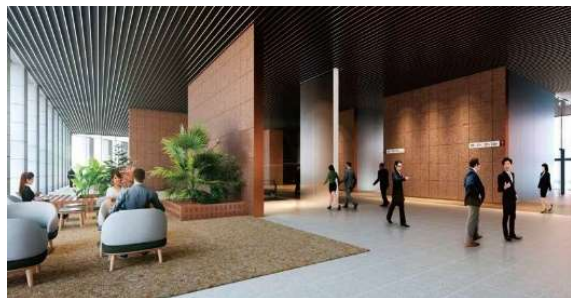
3Fオフィスロビー(イメージ)

住所: 大阪府大阪市中央区北浜3-6-22 竣工: 2025年5月 構造: S造、一部SRC造・RC造 規模: 地下3F、地上31F、塔屋1F 基準階面積: 高層階507.33坪 空調: 個別空調 床仕様: OA707A150mm 天井高: 2,900mm 駐車場: 平置き10台(内、身体障害者用3台) 機械式108台 エレベーター: 高層用6基、中層用6基、低層用4基 展望用2基、非常用2基