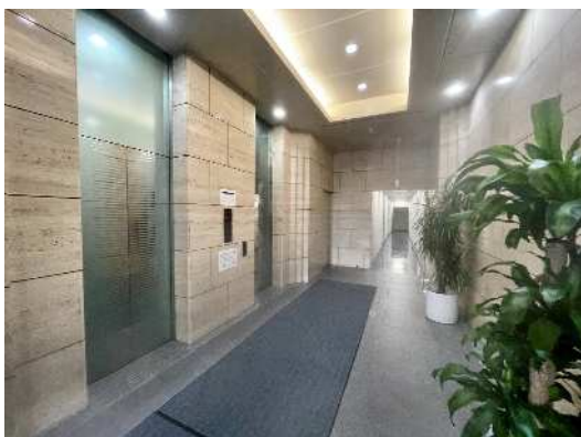
開放感のあるエレベーターホール