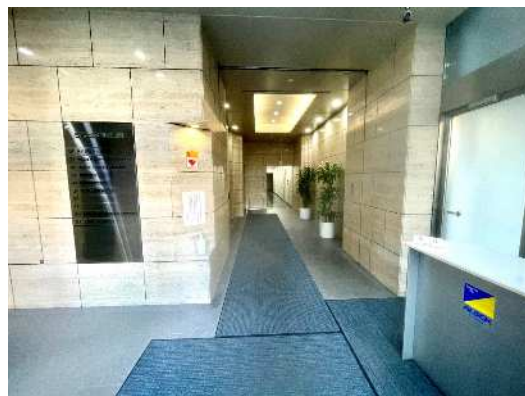
警備員駐在のエントランス