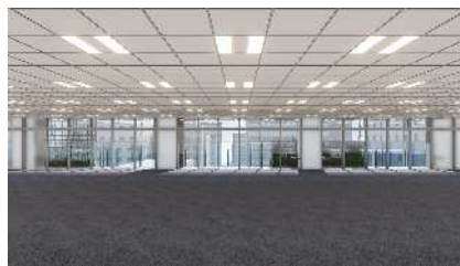
基準階貸室(イメージ)