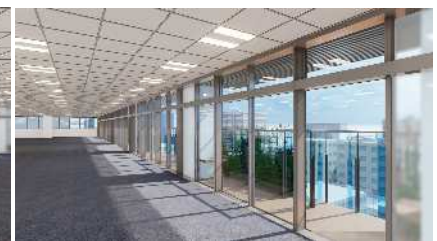
基準階設置テラス(イメージ)