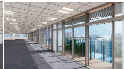
基準階設置テラス(イメージ)