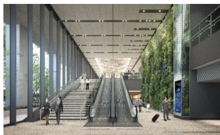
1Fエントランス(イメージ)