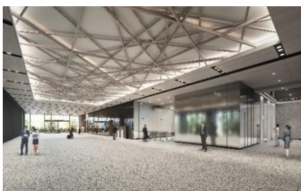
2Fオフィスエントランス(イメージ)